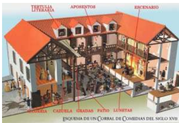
Distribución de las diferentes estancias de un Corral de Comedias clásico.