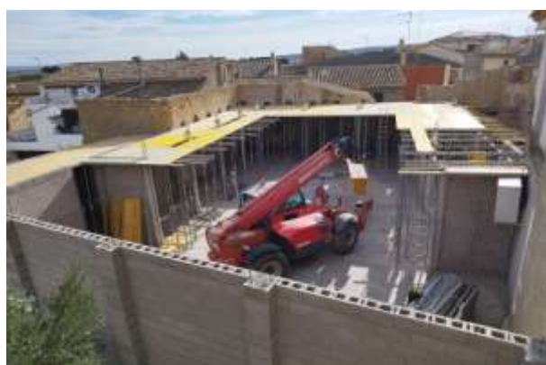
Levantando la estructura del futuro Patio, donde se aprecia la ubicación de la Cazuela y las Galerías.