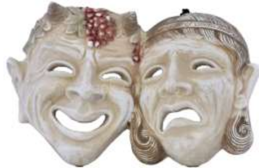
Máscaras de las musas del Teatro

Establecer un Santuario en tierra de Los Monegros es lo que sucede en Robres desde hace muy poco tiempo; será dedicado al arte de Molpómene y Talía, musas griegas del teatro que lo son, ya, de esta villa.