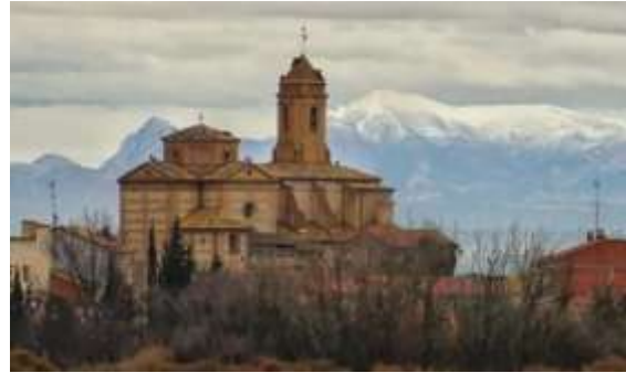
Detalle de la localidad de Robres

Discretísimos oyentes prestadme algo de atención que explique someramente esta digna construcción, no digan vuestas mercedes que nadie antes les habló de este edificio emblemático que en Robres se construyó.