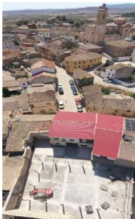
Localización urbana del solar.

Por su escena pasarán personajes de leyenda creados por los autores en obras de referencia: Lisístrata, Celestina, Don Juan, Otelo, Julieta, Yerma, Bernarda y Antígona, Hamlet, Medea o Electra.